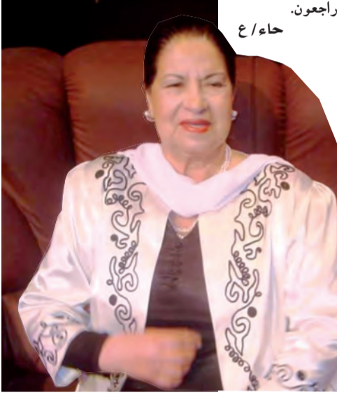
حاء / ع راجعون.

وذوي الحقوق، العيد ربيقة، وممثل وزيرة الثقافة والفنون، ميسوم لعروسي، وكذا العديد من الفنانين وأشاد وزير المجاهدين وذوي الحقوق، السعيد ربيقة، في كلمة تأبينية، بالخصال النضالية للمجاهدة فريدة الفن الجزائري، فريدة صابونجي، التي تعد من حرائر الجزائر التي نشأت مع رواد الحركة الوطنية الجزائرية وأدرت ميكرا حقيقة الاستعمار، وتنتمي إلى الرعيل الأول للشورة التحريرية المجيدة التي التحقت بصفوفها سنة 1955، كما ذقت مرارة السجن سنة 1957. وتعتبر الراحلة فريدة صابونجي من رائدات الفن المسرحي والسنيماي في الجزائر، حيث دخلت المسرح في سن مبكرة جدا وكان عمرها لا يتجاوز 13 سنة، كما دخلت عالم الفن من باب الإذاعة سنة 1947، وقدمت في خمسينيات القرن الماضي العديد من الأعمال الفنية والأدوار في المسرح الكلاسيكي، إضافة إلى العديد من الأعمال المسرحية الكلاسيكية مع نجوم الفن الجزائري على غرار مصطفى كاتب، محمد التوري، نورية، كلثوم، وأدت المرحومة أيضا عدة أدوار بمسلسلات عديدة منها "المصير"، "كيد الزمن"، "دار البهجة" و"دار أم هاني"... رحم الله الفنانة فريدة صابونجي وأسكنها فسيح جناته. إنا لله وإنا إليه