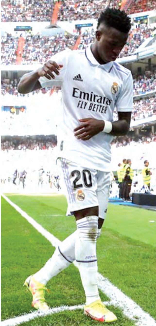
أقل من 48 ساعة على مباراة ديربي فينيسيوس في حال التسجيل على ملعب (واندا ميتروبوليتانو) سيمثل "مشكلة بالتأكيد".