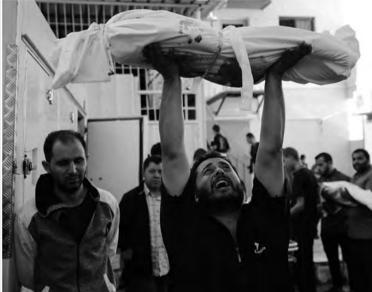
وأضافت الرسالة "في غزة تجري الآن مذبحة ذات أبعاد متطرفة، مما أسفر عن

نشر عدد من مخرجي الأفلام الحائزين على جوائز، بما في ذلك الأوسكار والسعفة الذهبية، رسالة مفتوحة دعوا فيها إلى وقف فوري لإطلاق النار في قطاع غزة والإفراج عن المحتجزين.