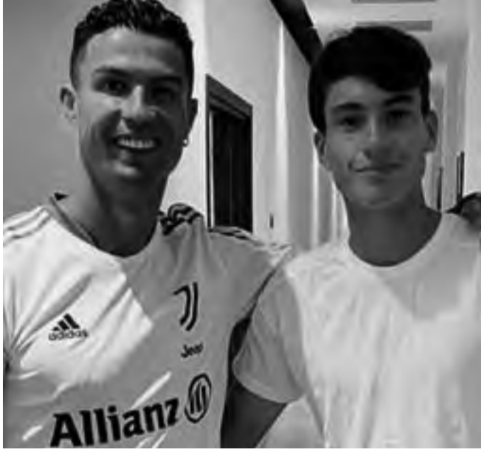
جودته، أتذكر يوماً ما ذهبنا لتناول الطعام وكنت جالساً على الطاولة، اقترب مني

وأخذ طعامه وجلس بجوارى، كانت هناك أماكن أخرى فارغة، لكنني كنت متوتراً للغاية لأنها كانت المرة الأولى التي أتقيبه فيها. وأضاف: "بدأنا نتحدث عن كل شيء، غادر الجميع من البوفيه وبدأ هو يخبرني بكل شيء، لم أصدق ما سمعته، لأنك تعلم أن هناك شائعات عن كريستيانو أنه مغرور أو لا يمكن لأحد معرفة شخصيته، لكنه شخص رائع وعبقري، تحدثت معي عن كل شيء: عن السيارات التي يملكها، وكيف كان وضعه في مدريد، لقد كان الأمر مدهشاً حقاً. وخلال مشاركته في 28 مباراة بالدوري الإيطالي هذا الموسم، مع فريق فروسينوني، ساهم الأرجنتيني ماتياس سولي في تسجيل 12 هدفاً (سجل 10 وصنع 2).