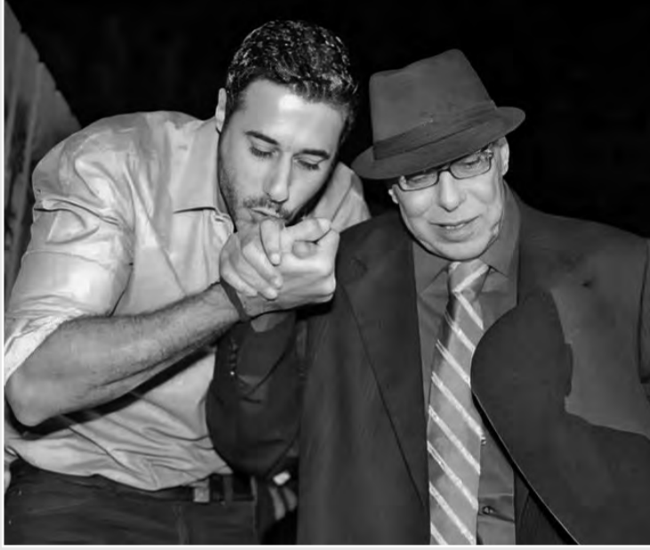
بشخصية العمدة، بعدما أصبح ملتصقا للغاية بتلك الشخصية، وحصل على بعض ملامحها من شقيقه الأكبر الكاتب محمود السعدني.

وترشح للمسلسل أحمد زكي ولكنه لم يحضر في الموعد، ثم عادل إمام لكنه طلب بعض التعديلات التي رفضها أسامة أنور عكاشة، كما اعتذر محمود عبد العزيز بسبب تضارب المواعيد، ليحظى الراحل السعدني بالدور في نهاية المطاف، ويقدم واحدا من أهم أدواره في الدراما أيضا.