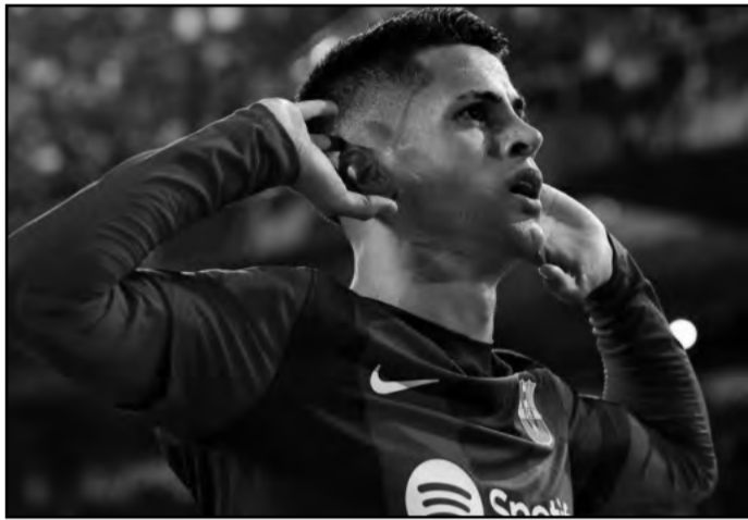
مانشستر يونايتد له بأنه كان سخيلاً وساذجاً كأنه لاعب عديم الخبرة، علق:

"كان لاعب رائعاً، لكنني متأكد أنه ارتكب أخطاء أيضاً، وكلنا نفعل ذلك، وحالياً وظيفته محلل وله الحق في أن يقول ما يريد". وزاد: "أتقبل رأيه، وربما الطريقة التي تم احتساب ركلة الجزاء بها ضدنا كانت خطأ طفولياً. وواصل: "لا أمانع أن تنتقد أدائي، لكن غير مسموح الحديث عن عائلتي، وكان أسبوعاً صعباً حقاً لأنكون صادقاً، وفي تلك الليلة لم أنم، وحين لا أفز أجد صعوبة في النوم. وأتم: "أنتحدث عن نفسي. لقد كانت مباراة غريبة، والطريقة التي خسرنا بها منعتني من النوم، وأشعر أنه كان بإمكاننا الفوز لو كنا 11 ضد 11.