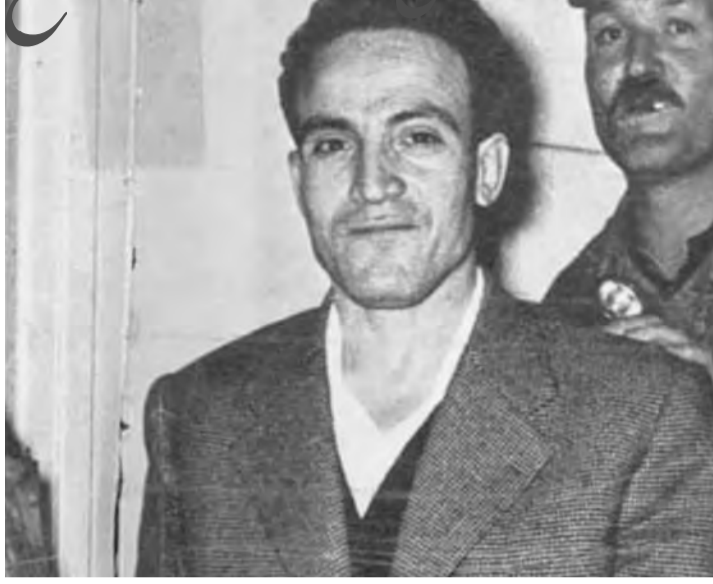
صاحب المقولة الشهيرة: "ألقوا بالثورة إلى الشارع سيحتضنها الشعب"