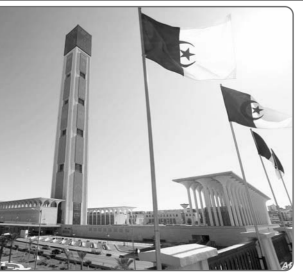
الجزء الثاني من خطبة الأمانة من جامع الجزائر

إن بذل الصدقة للمحتاج من أعظم الإحسان؛ لأنها تشبع جاعنا، أو تكسو عارياً، أو تعالج مريضاً، أو تقضي ديناً، أو تنوي مشراً، أو تكفل أرملة ويتيمماً، وكثير من الناس يحترق قليل الصدقة فلا يبذلها، فيستحي أن يبد للفقر دنانير، ويخجل أن يقدم شيئاً من طعام، أو قطعة من لباس أو أثاث. وكم من قلة ما يبذل الواحد من الإنفاق.. وكم من عازم على الصدقة نظر في محفظته فلم يجد إلا قليلاً من مال جهده عن الصدقة، وكم بقي للواحد من غداه وعشائه فاستقل أن يطعم به أحداً. مع أن اللبنة الواحدة تكسر حدة الجوع، وقد عد النبي صلى الله عليه وسلم في حديثه للصحابة رضي الله عنهم أن من الصدقة