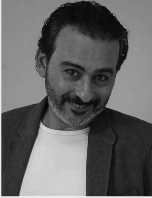
خالدة"، وفيلم "المنبر" في الإمارات