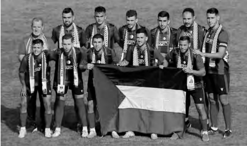
بشبيبة الساورة في المرتبة التاسعة (7 نقاط)، في (8 نقاط) بمعية وفاق سطيف ومولودية وهران. حين يواصل اتحاد بسكرة احتلال الصف السادس

التحق فريق اتحاد الجزائر بمولودية الشباب قسنطينة في صدارة بطولة الرابطة المحترفة الأولى لكرة القدم بثلاثة رؤوس، عقب عودة اتحاد الجزائر، السبت، بالتعادل (0-0) من خرجته إلى الشلف، أمام الأولمبي المحلي، في الوقت الذي عادت فيه شبيبة القبائل إلى سكة الانتصارات بعد أن أطاحت بضييفا اتحاد خنشلة (1-0)، لحساب الجولة السادسة.