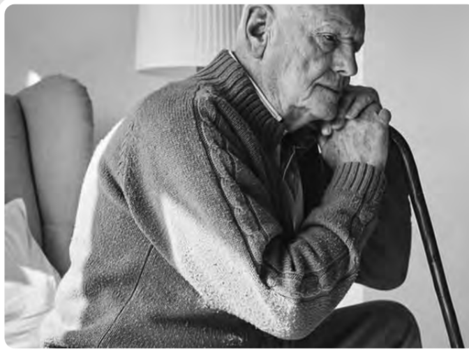
ورجله، ولطالما كانت تسمع عنه الأذى بيمينها، وتسهر عليه إذا اشتكى، فلا تنام حتى ينام، ولا

الجامعات تشغلهم أفلام ومسلسلات الفضائيات عن تحصيل دروسهم. -الإسهام في نشر الرذيلة والإباحية، وسلبيات سلوكية من خلال التركيز على أفلام العنف والإغراء، والشوسع في الإعلانات، وهذا باعتداف أساتذة واجتماعيين غربيين فيقول "جيفري جونسون" من جامعة كولومبيا ومعهد نيويورك للطب النفسي: "إنه يتوجب على أولياء الأمور أن يتجنبوا السماح لأطفالهم بمشاهدة التلفاز لأكثر من ساعة يومياً على الأقل في فترة المراهقة المبكرة"، فلا بد من التأكيد على دور الأسرة في التوعية والتثنية السلبية للفضائيات، وتنظيم وقت الأسرة.