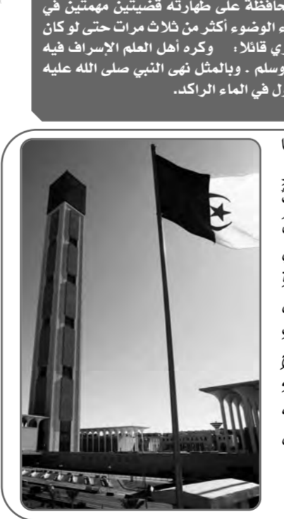
الجزء الثاني والأخير من خطبة الجمعة من جامع الجزائر

يقول الله تعالى "قُلْ لَّا يَسْتَوِي الْخَبِيثُ وَالطَّيِّبُ وَلَوْ أَعْجَبَكَ كَثْرَةُ الْخَبِيثِ فَاتَّقُوا اللَّهَ يَا أُولِي الْأَلْبَابِ لَعَلَّكُمْ تَتَّقُونَ" المائدة: 100. الله تعالى أمرنا أن نكون طيبين في أقوالنا وأعمالنا ودواتنا وأموالنا، ونهانا أن نكون من الخبيثين في أقوالنا وأعمالنا وأموالنا ودواتنا، فانظروا وتأملوا هل يستوي من طاب لسانه وطاب قلبه، فلا يقول إلا طيباً، ولا ينطق إلا خيراً، هل يستوي هذا مع ذلك الذي خبث عمله وفعله؛ ففراه بغش ويظلم ولا يراعي أمانة الله، متهمراً في الصلوات، إذا استرعى على مال أكله، وإذا استعمل على لأماته في وظيفته، هل يستوي هذا مع ذلك