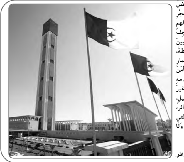
الجزء الأول من خطبة الجمعة من جامع الجزائر

وشرّاً، قلباً -أيها المسلم- ناظر فيك في بلاد الله الواسعة من شرقها إلى غربها، ومن قاصصها إلى دانيها: تجرد بلاد الإسلام تتن تحت وطأة الجهل والفقر والتخلف، وما زاد الطين بلةً تفرق الكريمة، وسحق الهوة بين أبناء الملة الواحدة، فصنع صرخ الأمة، وكثرت المحن والفتن والبلايا، وتكاثرت الأمم على هذا الجسد البريض المنهك المتماكل، فصارت لقمة سائغة على مآبئة الناس، تتجمع عليها كما تتجمع الذباب على فريستها، وما يحدث في أولى القبلتين من تقتيل وتهجير، وما الموقف المخزي لبعض الغربيين، إلا خير شاهد على ما تعانين أمثنا من ويلات، وويل لنا من قوله عليه الصلاة والسلام كما في الصحيحين "ويل للغرب من شرّ قد أقرّس". إن الحرب الإجماعية التي سلطها اليهود المغضوبون على أرض فلسطين الأبية، وخصوصاً غزة المجاهدة المقاومة، فهي تعدّ سافر ومفوض على الأراضي المقدسة، بل على كل أمة الإسلام. إن ما يدور في أرض فلسطين العذرة اليوم، لهو الصراع المستمر بين الحق والباطل: بين عصبية متجذرة معتصبة للحقوق، منهكة للحرمات، وضعب ينشد الحق والعدل والحرية، وإقامة موازين القسط في حياة كريمة. إن ما تقوم به الأيادي الأتمة في بيت المقدس وأكاف بيت