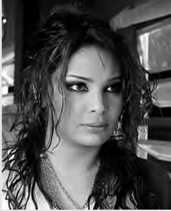
الضورسيوزون في القاهرة ولندن وجنيف، وتحدثت عن