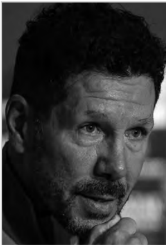
حاسم في المباراة.

برشلونة، الذي "لعب بشكل جيد للغاية وخلق فرصاً للتسجيل طوال الوقت"، واعترف المدرب الأرجنتيني بأن لاعبي برشلونة كانوا "أفضل بكثير"، حتى سجل بيدري هدف التقدم (1-0)، في الدقيقة 30، لكن فريقه دخل في أجواء المباراة بعد ذلك، عندما بدأت "طاقة" البلوغرانا في التراجع. وفي هذا الصدد، قال: "خلال الشوط الثاني، غيرنا أسلوبنا للضغط أكثر فأكثر، وأصبحنا أكثر تنافسية"، وتابع: "بعد هدف دي بول، دخلت المباراة مرحلة من المقاومة،