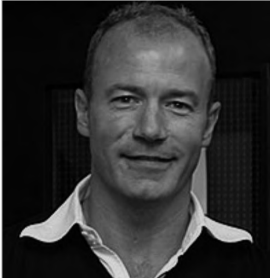
أبلغ إدارة ليفربول بالرحيل

حماس جماهير الفريق، حيث يحتل البلوز الآن المركز الثالث في جدول الترتيب بفارق 7 نقاط عن المتصدر ليفربول، الذي لديه مباراة مؤجلة. وكان آخر لقب أحرزه تشيلسي هو كأس العالم للأندية عام 2021، لكن شيرر يتوقع أن ينهي تشيلسي فترة الجفاف هذا الموسم بالإضافة إلى التأهل لدوري أبطال أوروبا. وعند سؤاله عما إذا كان تشيلسي "يتقدم عن المتوقع"، أجاب شيرر خلال