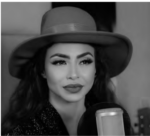
لأن لدي هدفاً معيناً أتطلع للوصول إليه، فأنا لا أقدم على شيء بشكل عشوائي، ولا

أخطو خطوة سوى بعد تفكير ودراسة، وأدرك ما أريده وأسعى لتحقيقه». وتؤمن دوللي بأن الغناء والتمثيل يكلمان بعضهما لكن لا يعوض أحدهما الآخر، وقد بدأت مطربة، وتعتبر عن حبها لأفلام «الأبيض والأسود» لعبد الحليم حافظ وصباح وسعاد حسني الذين ترى أنهم جمعوا ببراعة في أفلامهم بين مجالي التمثيل والغناء. ويسألها عن سبب غيابها درامياً، تقول: «أحب انتقاء أعمالتي، وأنا بصفتي فنانة أقدم العمل الذي أراه مناسباً لي، وليس مطلوباً مني أن أقدم كل ألوان الفن».