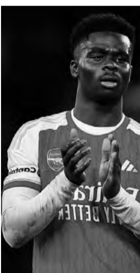
دوري أبطال أوروبا بسبب الإصابة في نفس الساق.

شهرين، سيعتمد على كيفية بدء التثام النسيج الندي في الأسبوع الأول أو في حدود هذه الفترة من الحركة، لنرى ما سيحدث، من الصعب تحديد موعد عودته". وسجل ساكا خمسة أهداف وقدم عشر تمريرات حاسمة في الدوري هذا الموسم باعتباره أحد صناعات اللعب الرئيسيين في الفريق اللندني. واضطر اللاعب (23 عاماً) إلى الخروج من مباراة فريقه أمام