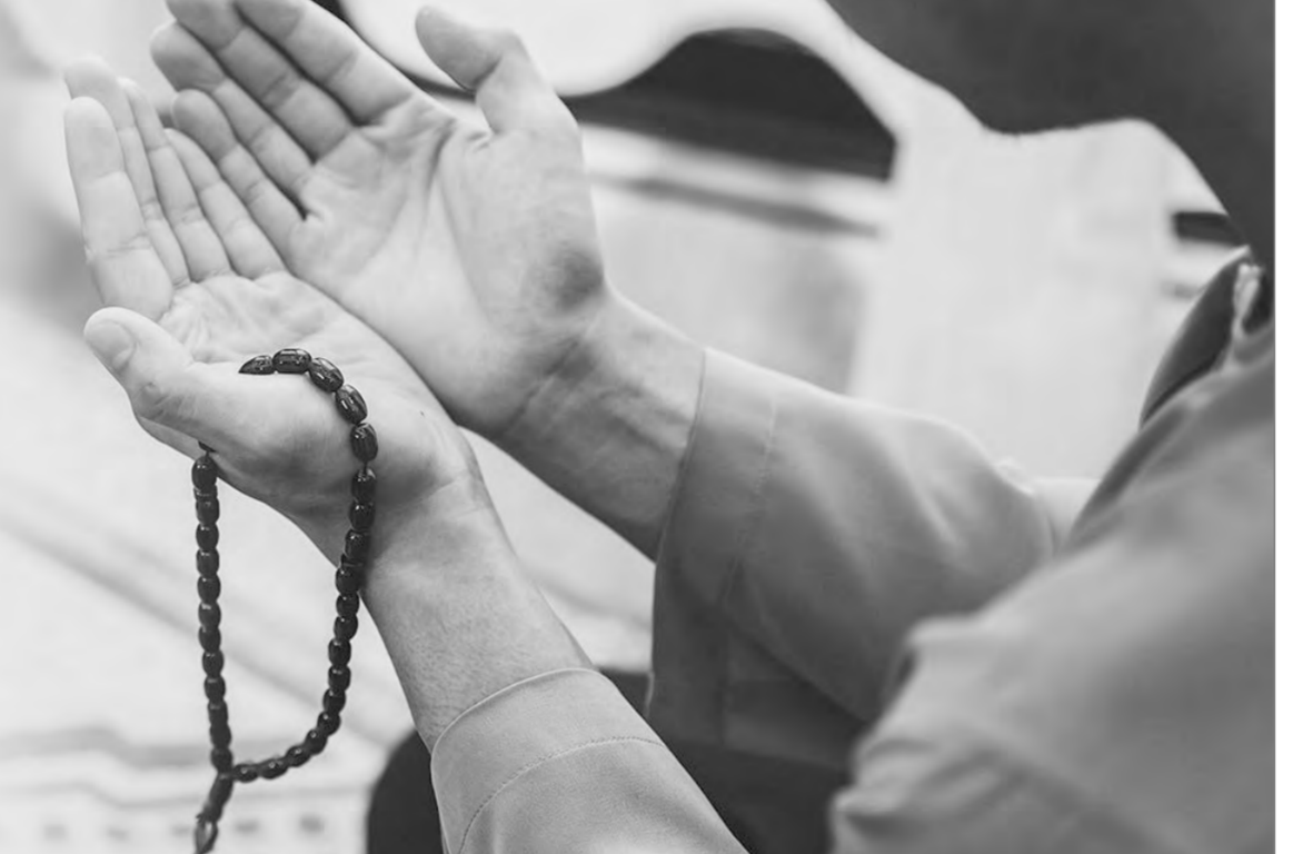
إن الهم الذي يصبح الناس عليه ويمسون، والهم الذي يشغل بال الجميع، والهم الذي يعمل له الجميع هو: كيف يكون رزق أحدنا داراً، وعيشه قراراً؟ وكيف تكون عيشته هنية؟ ويوسع له في رزقه؟ هذا سؤال جميع الناس به مشغولون، وجميع الناس يسألون في تحسين دخلهم، وفي تحسين مستوى معيشتهم. كل شخص يتمنى أن يكون رزقه واسعاً ومباركاً، وكل شخص يخشى الفقر، لأن الفقر شبح مخيف، كل الناس يأمل الغنى ويخشى الفقر، كل الناس يخشى أن يبعد يده للناس، وأن يحتاج للناس. بعض الناس تجده يتقرب عن بلده، ويتبعد عن أهله، وبعضهم يسهر الليالي، ويعمل بزم إنشائي، وكل هذا لتحسين الدخل، ولزيادة الرزق، فكلنا يريد أن يكون رزقه واسعاً، وعيشه كريماً. والسؤال:

عز وجل سبب لخيري الدنيا والآخرة: "ومن يتق الله يجعل له مخرجاً ويرزقه من حيث لا يحتسب" الطلاق: 3، 2. "ومن يتق الله يجعل له من أمره يسراً" الطلاق: 4. "ولو أن أهل القرى آمنوا واتقوا لفتحنا عليهم بركات من السماء والنار" الأعراف: 96. فالواجب على الإنسان أن يتق الله عز وجل؛ خصوصاً في المكسب وفي الرزق، يحرس الإنسان على ألا يطعمه إلا حلالاً طيباً، وألا يطعمه ابتغاء إلا حلالاً طيباً. تلك - صلة الرحم: صلة الرحم، تلك العبادة التي أصبحت مفقودة في زماننا هذا، وأصبح قليل من الناس يحرص عليها. صلة الرحم من أسباب الرزق، وفي أبواب الرزق، قال رسول الله صلى الله عليه وسلم: "من سزه أن ينسط له في رزقه، أو ينسا له في أثره، فليصل رحمه"، الذي يزيد - تقوى الله، تقوى الله