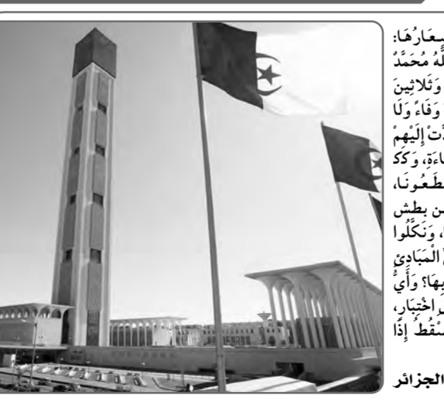
الجزء الأول من خطبة الجمعة من جامع الجزائر