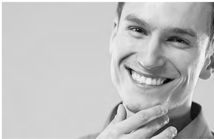
تغيير حالته المزاجية السيئة. الابتسامة تعزز جهاز

المناعة على العمل بشكل أفضل، فهي تحسن وظائف المناعة وتجعلك أكثر استرخاءً، كما أنها فعالة جداً في محاربة الانفلونزا ونزلات البرد. كما أظهرت الدراسات السابقة أن الابتسام يساعد على فرز الأندورفين والسيروتونين، وهي مسكنات ألم طبيعية، وتعطي شعوراً بالفرح. هذا يعني أن الابتسامة أشبه بالمخدرات الطبيعية! أخيراً وليس آخراً، الابتسامة تساعد على شد الوجه وجعله أكثر نضارة.