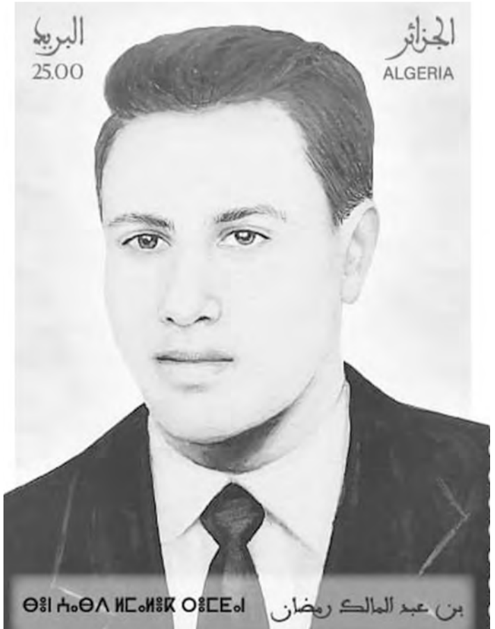
بن عبد المالك رضوان

واستشهد البطل "بن عبد المالك رمضان" مبكرا جدا، ففي 04 نوفمبر 1954 بالقرب من "سيدي علي" تم استشهاد البطل خلال اشتباك مع قوات الاحتلال، وبذلك يكون أول قائد عسكري للثورة يستشهد في سبيل استرجاع السيادة الوطنية.