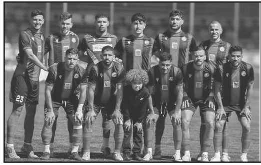
الناسي برصيد 52 نقطة. الضغط بعد فوزه العريض على واداد تلمسان (4-1)، بينما

وفارق 12 نقطة كاملة، مع أفضلية في المواجهات المباشرة على ملاحظيته اتحاد الحراش وجمعية وهران (52 نقطة لكل منهما)، لم يعد بالإمكان اللحاق بمصدر الترتيب قبل أربع جولات من نهاية الموسم. وبحصيلة 20 انتصارا مقابل هزيمتين و4 تعادلات، يقدم هذا النادي العريق من مرتفعات الجزائر العاصمة، الذي تأسس في 15 ديسمبر 1944، مشورا استثنائيا، محققا