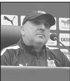
بعد، سنحضر أكبر وأكبر للقاء العودة، وسنبذل أقصى ما لدينا من أجل خطف ورقة التأهل في القاهرة".