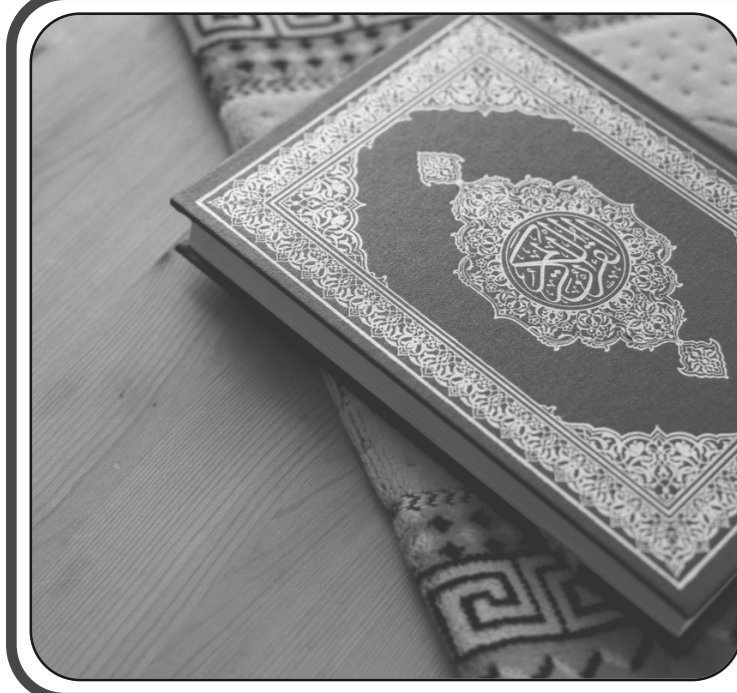
من موقع الأنوكة الإسلامي

قبل أن نبدأ في سرد قصة أصحاب السبت، سنذكر شيئاً مهماً ألا وهو: أن الله أمر اليهود بتعظيم يوم الجمعة فاختاروا السبت مكانه معتلين بأن الله لم يخلق فيه شيئاً، لأنه بدأ الخلق يوم الأحد، وافرغ يوم الجمعة، وهذا من تطهيمهم وضلالهم وتقديمهم أراهم على شرع ربهم، ووضع عليهم في ذلك الإصر والأغلال فحرم ذو العزة والجلال على اليهود العمل يوم السبت، وحدث في يوم السبت واقعة قبيحة قام بها اليهود، فقد كانت هناك قرية من قري بني إسرائيل مظلة على البحر، وكان أغلب عمل أهل تلك القرية صيد السمك، وحدث لهم ابتلاء عظيم، فكانت الأسماك تأتي كل أيام الأسبوع عدا السبت، تأتي بكثرة حتى إنه بالإمكان اصطيادها باليد، وهذا عجيب: فالأصل أن الحلال كثير والحرام قليل، لكن لماذا نجد أحياناً أن أبواب الحرام أكبر؟ جواب هذا نجد في تسمية الآية أيها الحضور، قال تعالى "كذلك نبلوهم بما كانوا يشقون". فإنا ترى ماذا سيفعلون؟ هل سيرجعون إلى الله ويعلمون نوبتهم أم ماذا سيفعلون؟. أصروا على اصطياد الأسماك، فحضروا الحفر ووضعوا الشباك يوم الجمعة، فإذا ذهب السبت أخرجوا الحيات، وبالفعل عمل بعضهم هكذا، وأخرجوا الحيات يوم الأحد وقام بعضهم بشواتها، فأنتشرت الرائحة في أنحاء القرية وتسامل الناس: من أين لكم الحوت؟ فأجابوهم بفعلتهم وأنهم فعلوا كذا وكذا. وهنا انقسمت القرية إلى ثلاث مجموعات: المجموعة الأولى: تابعت ما فعله بعض الناس وأصبحوا يبلغيهم بطبوعها، المجموعة الثانية: كرهت هذا الفعل