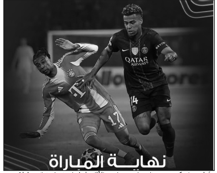
عبر لويس إنريكي، مدرب نادي باريس سان جيرمان، عن سعادته بالفوز على بايرن ميونخ أبطال أوروبا بواقع 5-4، معتبراً أن فريقه

أبان عن وجهه الحقيقي، وأنه لم يحدث أن حضر لمباراة بهذه الفراسة والرغبة الجارحة في الفوز منذ زمن. وقال التقني الإسباني: "أنصار الفريقين سعداء بهذا الأداء الرائع، لم نتهاون بدنياً، ولم أر وتيرة كهذه من قبل، نهى التشكيلتين وجميع اللاعبين، عندما تتقدم بثلاثة أهداف، يُجازف الخصم كثيراً، وهم فريق على مستوى عال جداً". ولفت إنريكي إلى أنها كانت مواجهة شاقة، وستكون كذلك في مباراة الإياب وقال: "هذه هي المباراة الثالثة فقط التي يخسرها بايرن هذا الموسم، نحن سعداء، أظهر كلا الفريقين روحاً قتالية عالية". وأضاف إنريكي: "سعداء للغاية، وأعتقد أننا