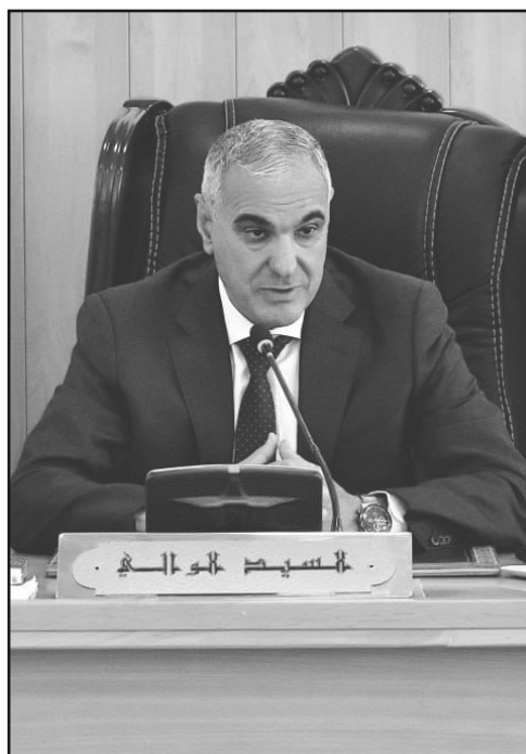
مع التبليغ الفوري عن أية تجاوزات