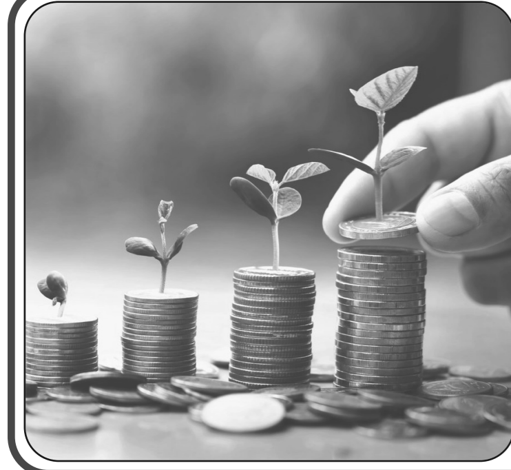
من موقع الألوكة الإسلامي