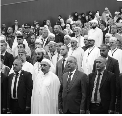
في إطار تعميق الدراسات والأبحاث المتعلقة بتاريخ منطقة الونشريس