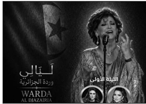
المركز الوطني للوثائق والصحافة والصورة والإعلام.

ويأتي هذان الحفلان في إطار الحدث الموسوم بـ "ليالي وردة الجزائرية"، الذي افتتح يوم 17 ماي (ذكرى رحيلها سنة 2012) والذي اختتم، أمس، والمنظم تحت رعاية وزيرة الثقافة والفنون، السيدة مليكة بن دودة، التي حضرت السهرة الأولى برفقة وزير الاتصال، السيد زهير بوعامة، ووزيرة التكوين والتعليم