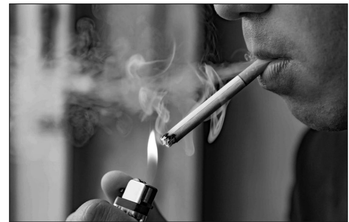
الظاهرة خاصة مع تزايد استعمال السجائر الإلكترونية.

ولا تقتصر خطورة التدخين على المدخنين فقط بل تمتد إلى الأشخاص المحيطين بهم من خلال التدخين السلبي، الذي يتعرض له الأطفال والنساء وكبار السن داخل المنازل والأماكن المغلقة، ويُحدث عتقون من أن خاصة في ظل ارتفاع أسعار السجائر