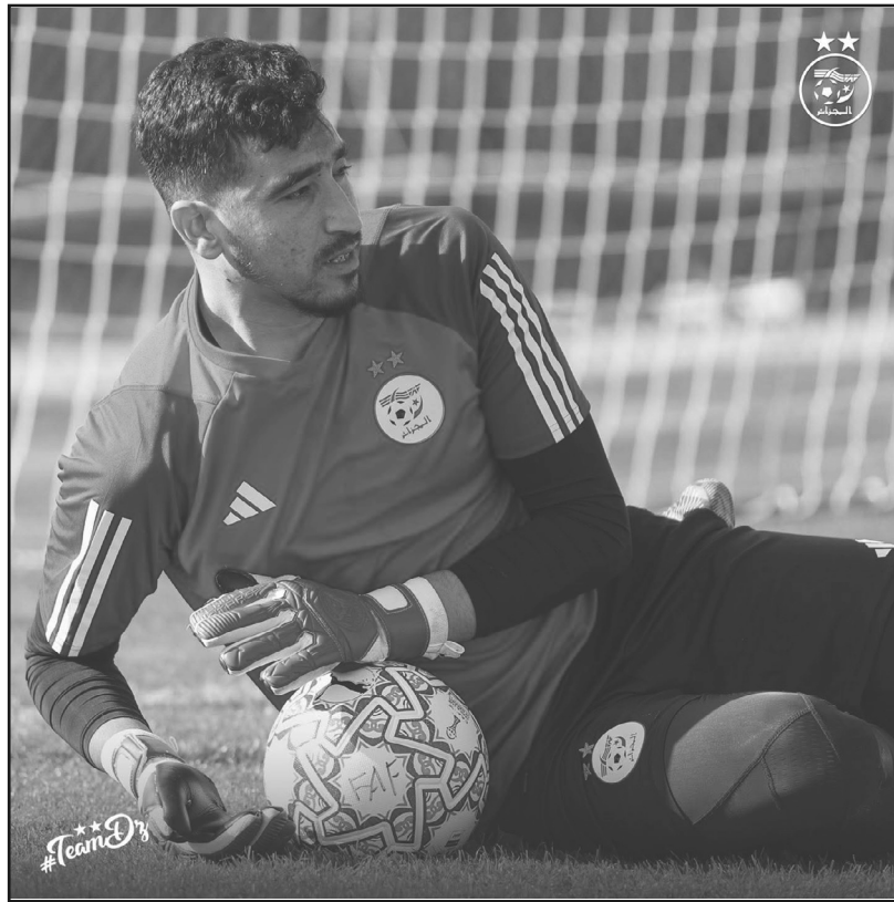
قرعة الرياضات الجماعية لألعاب تارانتو المتوسطية