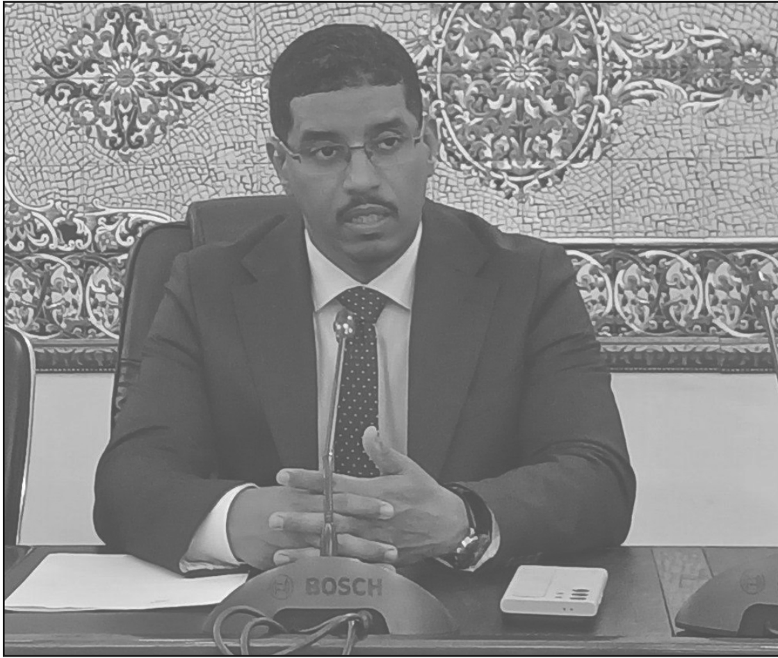
استعداداً لتهيئة شواطئ سطاوالي