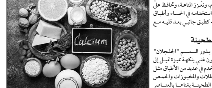
الطحينة الطحينة المصنوعة من بذور السمسم "المجلجلان" الطحينة، هي معجون غني بكمية جيدة من الكالسيوم، وتستخدم في العديد من الأطباق مثل تبيبات السلطة والمخللات والخبزات والحمص والصلصات. تتميز الطحينة بانخفاضها بالعناصر

يعد الكرنب الأخضر من الخضروات الورقية الغنية بالكالسيوم، حيث يحتوي كوب ونصف منه بعد الطهي على كمية تفوق ما يحتويه كوب من الحليب، كما يتميز باحتوائه على فيتامين ك، وفيتامين سي، وبيتا كاروتين، وهي عناصر تدعم تخثر الدم، وتعزيز المناعة، وتحافظ على صحة العين، ويمكن استخدامه في الحساء وأطباق المعكرونة، أو تقديمه كطبق جانبي بعد قلبه مع التوابل.