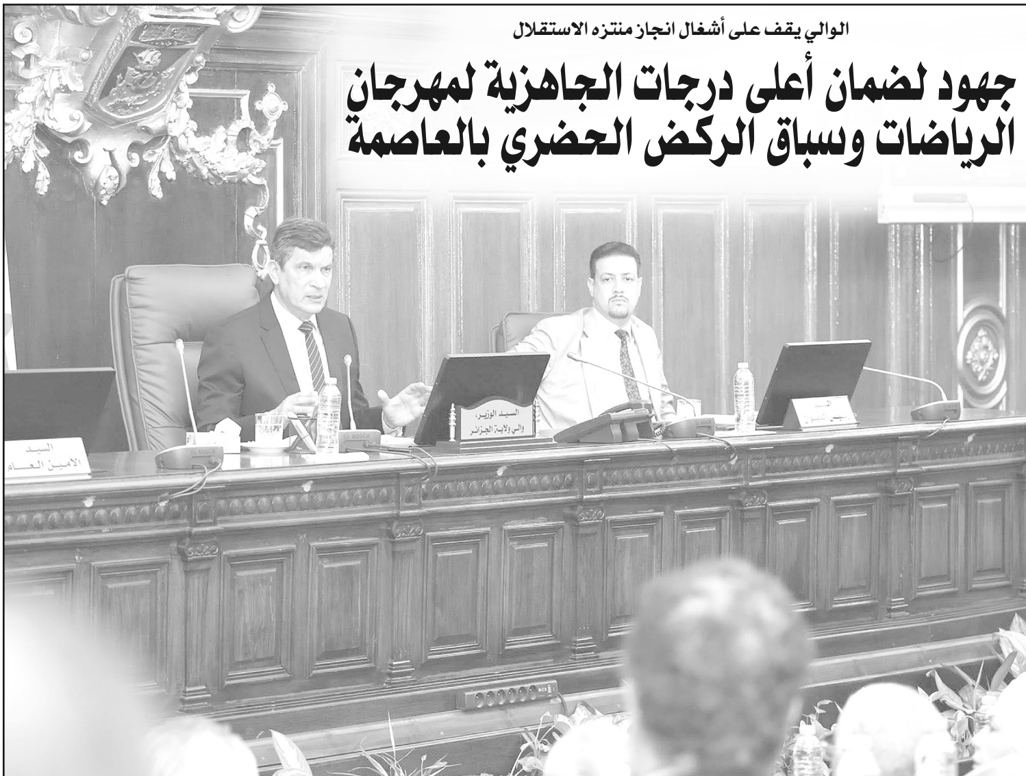
الوالي يقف على أشغال إنجاز منتزه الاستقلال