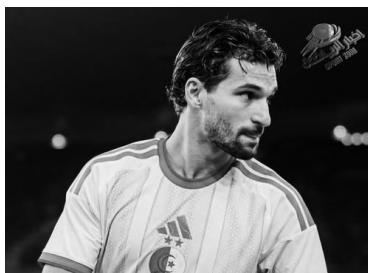
من أصحاب الخبرة، موجودين لخدمة المنتخب.

وعن مواجهة الدور الثاني أمام سويسرا: "الآن سندرس ما حققناه من شيء إيجابي في مباريات الدور الأول ونصحح الأخطاء قبل المواجهة المقبلة التي سنلعبها من أجل الفوز لإسعاد الجزائريين".