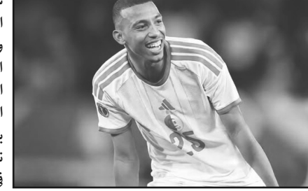
كأس العالم. منتخب سويسرا جيد ومن جانبنا سنحاول الاستعداد جيداً للقاء والتركيز على