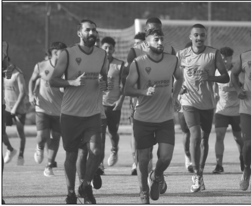
الجمعية العامة لاتحاد الجزائر

أشرفت إدارة مولودية وهران في مخطتها الرامية إلى ضم الطيور النادرة خلال الميركاتو الصيفي بقوة، بعدما أعلنت، أن التعاقد رسمياً مع أربعة لاعبين جدد، في خطوة تؤكد سعيها إلى بناء فريق تنافسي استعداداً للموسم الكروي 2027-2026.